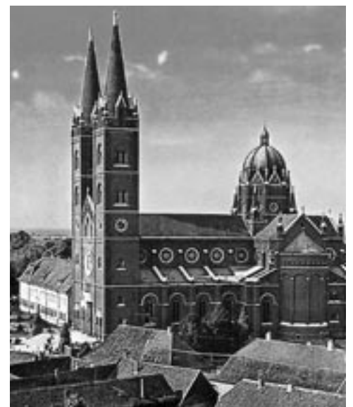
Kathedrale in Đakovo/Kroatien