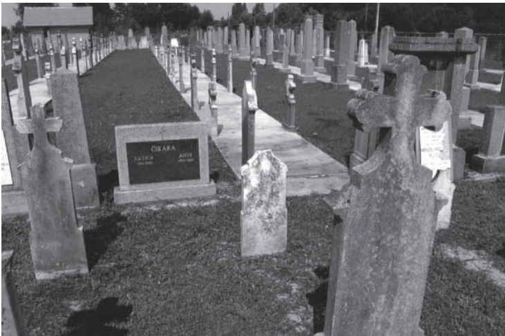
317 neu aufgestellte Grabsteine