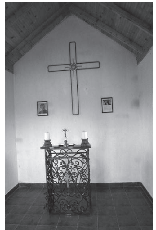
Detailinnenansicht der Kapelle