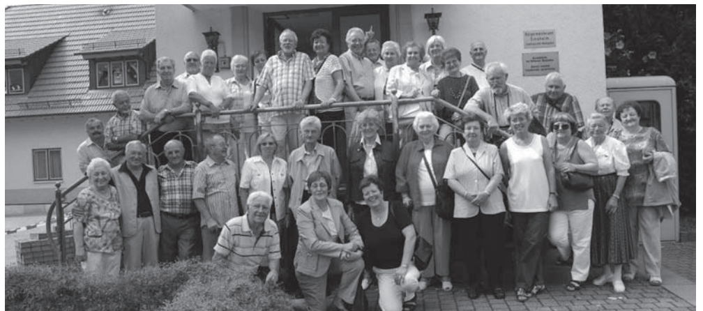
Vor dem Rathaus in Waldangelloch