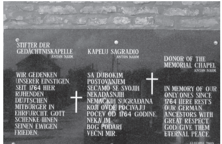
Tafel an der Aussenwand der Kapelle