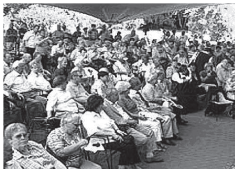
Blick ins Publikum