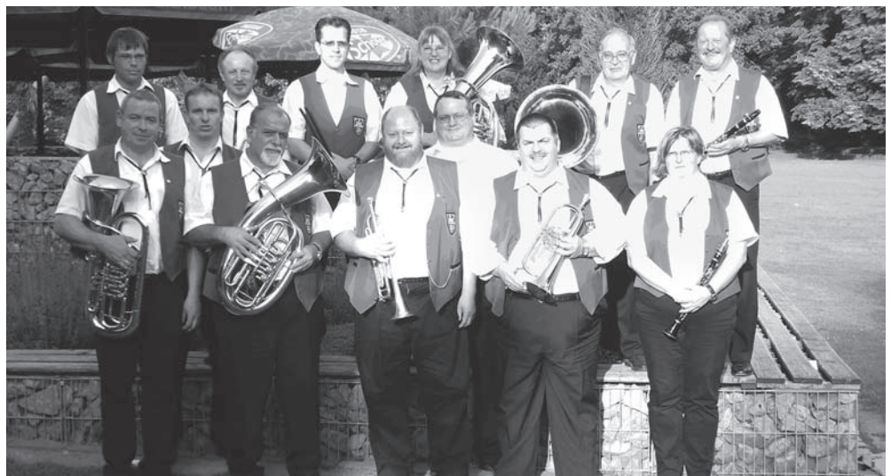
Ungarndeutsche Heimatblaskapelle Backnang