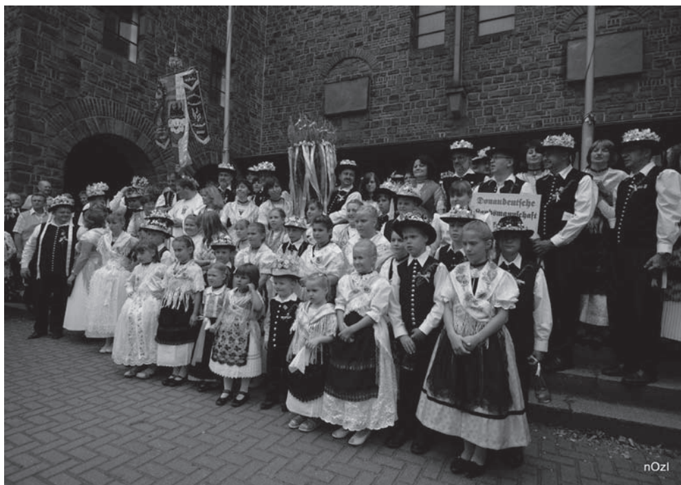
Trachtengruppe Frankenthal vor der St. Ludwigskirche

Im Hof des Donauschwabenhauses waren Zelte aufgestellt, Kaffee und Kuchen, Gegrilltes und Getränke standen bereit und die meisten der vielen Sitzplätze waren bereits besetzt.