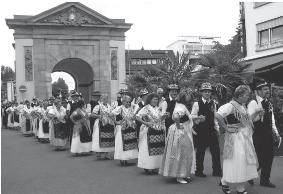
Trachtenzug zum Rathaus, im Hintergrund das „Wormser Tor“.