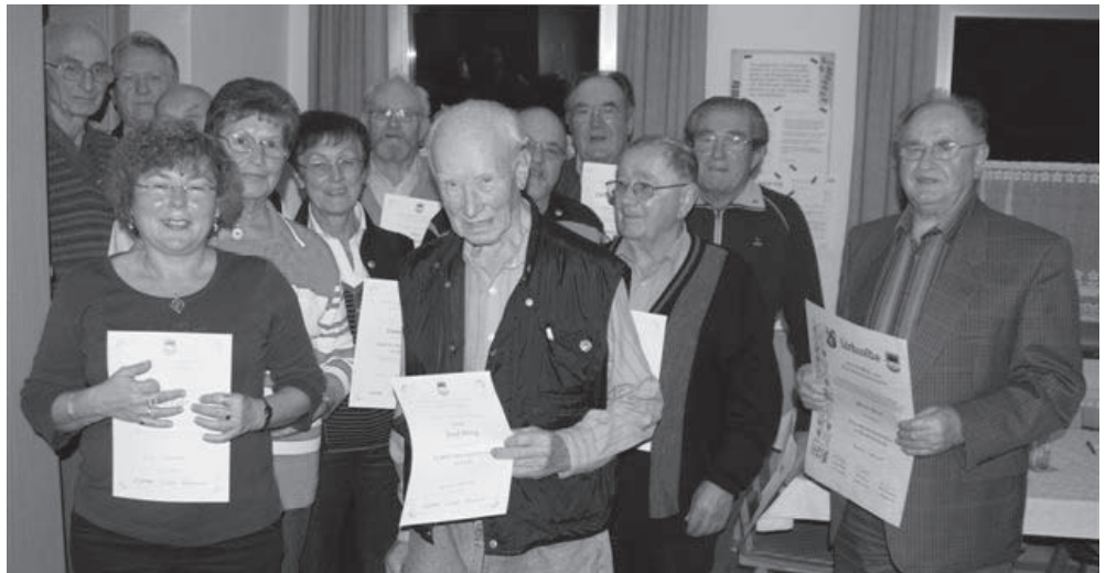
Die Geehrten in Mutterstadt am 21. Oktober 2008